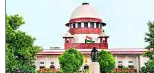
नहीं होने पर विशेषाधिकार हनन के लिये जिम्मेदार ठहराने का अधिकार नहीं है। विधानसभा की यह समिति इस साल फरवरी में दिल्ली में हुये दंगों के संबंध में कथित नफरत फैलाने वाले भाषण के मामले में सोशल मीडिया के इस मंच की भूमिका की जांच कर रही है। मोहन की ओर से

वर्षिक अधिकार हरीश साल्वे ने कहा कि समिति सदन के विशेषाधिकार हनन के बारे में फैसला नहीं ले सकती है और सोशल मीडिया पर केंद्र सरकार का प्रशासनिक नियंत्रण है। साल्वे ने कहा, विशेषाधिकार ऐसी चीज है, जिसके बारे में विधान सभा यह निर्णय करना होता है। एक समिति यह निर्णय नहीं कर सकती कि क्या विशेषाधिकार के सवाल पर कार्रवाई की जा सकती है या नहीं। उन्होंने कहा कि दिल्ली सरकार मोहन को इस समिति के समक्ष पेश होने के लिये बाध्य करके दंड की पीड़ा नहीं दे सकती है। उन्होंने कहा कि मोहन की संविधान के अनुच्छेद 19(1)(ए) के तहत नहीं बोलने का मौलिक अधिकार है और अमेरिका स्थित कंपनी में काम करने की वजह से वह राजनीतिक दृष्टि से संवेदनशील मुद्दे पर टिप्पणी नहीं करना चाहते। साल्वे ने कहा, यह विषय बहुत ही संवेदनशील है।