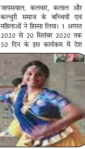
जायसवाल, कलवार, कलाल और कल्चुरी समाज के बच्चियों एवं महिलाओं ने हिस्सा लिया। 1 अगस्त 2020 से 20 सितंबर 2020 तक 50 दिन के इस कार्यक्रम में देश

(सुरेश गांधी/वृत्त एक्सप्रेस) वाराणसी। अखिल मुंबई जायसवाल सभा के तत्वावधान में ‘वर्चुअल आजा नच ले’ = 20 20 डांस प्रतियोगिता का आयोजन किया गया। उक्त स्पर्धा में पंजीयन से लेकर कार्यक्रम के अंत तक सभी एक्टिविटी वर्चुअल तरीके से कराया गया। प्रतियोगिता में कुल 150 प्रतिभागियों ने भाग लिया। इसमें यूपी के वाराणसी, आजमगढ़, प्रयागराज के अलावा गुजरात, महाराष्ट्र, राजस्थान, कर्नाटक, उड़ीसा दिल्ली देशविदेश के कोनेकोने से बच्चों ने भाग लिया। प्रतियोगिता में प्रतिभागियों को कुल चार राउंड से गुजरना था। अंत में सभी विजेताओं को ऑनलाइन प्रशस्ति पत्र देकर सम्मानित किया गया। जायसवाल ने बताया कि पहली बार अखिल मुंबई जायसवाल सभा के बैनरतले ऑनलाइन टेलीग्राम प्लेटफॉर्म पर ‘वर्चुअल आजा नच ले’ = 20 20 डांस प्रतियोगिता का आयोजन किया गया। प्रतियोगिता में