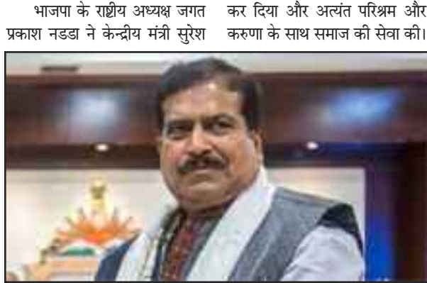
अंगड़ी के निधन से अत्यंत दुखी हैं। वह एक अच्छे नेता थे जिन्होंने अपना सारा जीवन संगठन के लिए समर्पित कर दिया और अत्यंत परिश्रम और करुणा के साथ समाज की सेवा की।

परिवार में पत्नी और दो पुत्रियां हैं। उन्होंने रात करीब आठ बजे अंतिम सांस ली। सुरेश अंगड़ी के निधन की खबर से हर कोई स्तब्ध है। प्रधानमंत्री नरेंद्र मोदी सहित समूची केंद्रीय कैबिनेट ने गहरा शोक व्यक्त किया है। प्रधानमंत्री नरेंद्र मोदी ने ट्वीट में कहा, सुरेश अंगड़ी एक असाधारण कार्यकर्ता थे, जिन्होंने कर्नाटक में पार्टी को मजबूत बनाने के लिए कड़ी मेहनत की। वह एक समर्पित सांसद और प्रभावी मंत्री थे, जो पूरे स्पेक्ट्रम में प्रशासित थे। उनका निधन दुःखद है। इस दुःख की घड़ी में मैं उनके परिवार और दोस्तों के साथ हूँ।