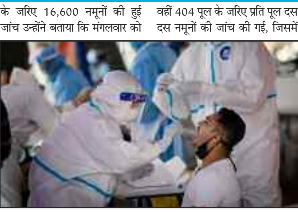
2,916 पूल के जरिए 16,600 नमूनों की जांच की गई। इनमें 2,512 पूल के जरिए प्रति पूल पांच पांच नमूनों की जांच की गई, जिसमें 331 पूल की रिपोर्ट पॉजिटिव आई।

लोग स्वस्थ होकर डिस्चार्ज किए गए। अब तक कुल 3,02,689 लोग इलाज के बाद पूरी तरह ठीक होने के बाद घर भेजे जा चुके हैं। राज्य में संक्रमण के बाद कुल मौतों की संख्या 5,299 पहुंच गई है। इनमें बीते चौबीस घंटे में 87 लोगों की मौत हुई है। वहीं राज्य में मरीजों के ठीक होने की दर वर्तमान में और बढ़कर 81.88 प्रतिशत हो गई है। अब तक कुल 89.92 लाख कोरोना नमूनों की हुई जांच उन्होंने बताया कि राज्य की विभिन्न प्रयोगशालाओं में कोरोना नमूनों की जांच में लगातार इजाफा किया जा रहा है। इसकी बदैलात अब तक कुल 89,92,424 कोरोना नमूनों की जांच की जा चुकी है। 2,916 पूल के जरिए 16,600 नमूनों की जांच की गई। इनमें 2,512 पूल के जरिए प्रति पूल पांच पांच नमूनों की जांच की गई, जिसमें 331 पूल की रिपोर्ट पॉजिटिव आई। वहीं 404 पूल के जरिए प्रति पूल दस दस नमूनों की जांच की गई, जिसमें 25 की रिपोर्ट पॉजिटिव आई। 31,791 मरीजों का होम आइसोलेशन में चल रहा इलाज उन्होंने बताया कि प्रदेश में वर्तमान में कुल सक्रिय मरीजों में से 31,791