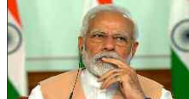
कोरोना के कुल पुष्ट मामलों का तकरौबन 65 फीसदी और कुल मृत्यु के 77 फीसदी मामले भी इन्हीं राज्यों और केंद्र शासित प्रदेशों से हैं। पंजाब, दिल्ली और अन्य पांच राज्यों में हाल ही में कुल मामलों की संख्या में काफी