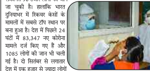
महाराष्ट्र में 21वें दिन लगातार हजार से ज्यादा लोगों की मौत हुई है। अबतक कोरोना से संक्रमित 90 हजार लोगों की जान जा चुकी है। हालांकि भारत दुनियाभर में रिकवरी केसों के मामले में सबसे टॉप स्थान पर बना हुआ है। देश में पिछले 24 घंटों में 83,347 नए कोरोना मामले दर्ज किए गए हैं और 1085 लोगों की जान भी चली गई है। दो सितंबर से लगातार देश में एक हजार से ज्यादा लोगों की मौत हुई है। अच्छी खबर ये है कि 24 घंटों में अबतक 89,746 मरीज ठीक भी हुए हैं। स्वास्थ्य मंत्रालय के ताजा आंकड़ों के अनुसार, देश में