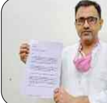
से जुड़ी योजनाएं एवं सरकार से जुड़ी गतिविधियों का प्रसारण नहीं हो पा रहा है। प्रधानमंत्री, हम काशीवासियों को इस बात का गर्व है कि हम सभी आपके संसदीय क्षेत्र में रहते हैं। इस संसदीय सीट पर पूरी दुनिया की नजर लगी हुई है। ऐसे में वाराणसी दूरदर्शन से प्रसारण का बंद होना काशी के लोगों के लिए एक बड़ा झटका और कष्टप्रद है। काशी के सांस्कृतिक विरासत को गांव में आमजन तक पहुंचाने का जो माध्यम था वह कड़ी टूट गई है। समस्त काशीवासियों का आपसे अनुरोध है फिर दूरदर्शन वाराणसी केंद्र से सुबह 8:00 बजे से रात्रि 9:00 बजे के बीच