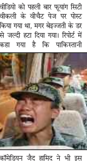
वीडियो को पहली बार फूयांग सिटी वीकली के वीचेट पेज पर पोस्ट किया गया था, मगर बेइजिंग के डर से जल्दी हटा दिया गया। रिपोर्ट में कहा गया है कि पाकिस्तानी

(विशेष संवाददाता) नई दिल्ली/बीजिंग। सीमा पर भारतीय सेना का पराक्रम देखकर चीनी सैनिक बुरी तरह घबराये हुए हैं। आलम यह है कि सीमा पर तैनाती के नाम से ही उनके आंसू निकलने लगते हैं। सोशल मीडिया पर चीन के सैनिकों का एक वीडियो वायरल हो रहा है, जिसमें वे रोते हुए नजर आ रहे हैं। दावा किया गया है कि ये सैनिक भारत सीमा पर अपनी पोस्टिंग होने के चलते दुखी हैं। ताइवान न्यूज की रिपोर्ट में कहा गया है कि इस वीडियो को पहले चीनी सोशल मीडिया वीचेट पर पोस्ट किया गया था, लेकिन बाद में इसे हटा दिया गया। यह वीडियो फूयांग रेलवे स्टेशन जाते समय बस में शूट किया गया है। सेना में भर्ती हुए इन जवानों को ट्रेनिंग के बाद भारत से लगी सीमा पर तैनाती के लिए भेजा जा रहा था। वीडियो में चीनी सैनिक रोते हुए चीनी सेना P.L.A का गीत ‘ग्रीन फ्लॉवर्स इन द आर्मी’ गाते दिखाई दे रहे हैं। ताइवान न्यूज के मुताबिक,